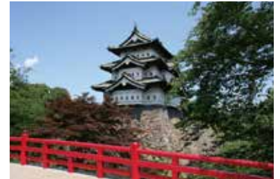
弘前公園総合情報サイト http://www.hirosakipark.jp

▶ 趣旨 学習指導要領の改訂に伴い、我が国の英語教育は大きな転換期を迎えていると言っても過言ではない。本セミナーは、新学習指導要領で求められている英語科授業の改善の具体的な方策について考える一助として開催するものである。